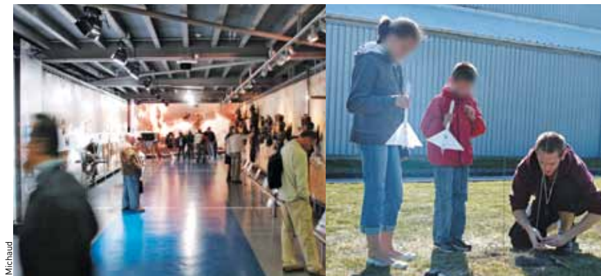
Ateliers Fusées, animés par des bénévoles, lors des dernières Journées du patrimoine.

« J'ai fait toute ma carrière chez Snecma (Groupe Safran) à Villaroche où j'ai travaillé en particulier sur l'étalonnage des bancs et la programmation des essais pour les moteurs M53, M88 et Atar. Une fois en retraite, j'ai rejoint l'association des amis du musée. Deux à cinq fois par semaine, j'accompagne un groupe de visiteurs pour leur faire découvrir les différentes pièces du musée. Mon implication ne s'arrête pas là : j'ai aussi participé à la réalisation de maquettes – notamment le Coléoptère – et à la fabrication d'un hydravion. Faire partie des amis du musée est formidable. Cela montre qu'on peut être utile à tout âge. En plus, en allant au musée, je retrouve des amis et d'anciens collègues, tous unis par la même passion. »